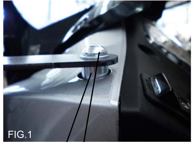
FIG.1 distanziale H9 vite M8x30+rondella piana

Montaggio: (tempo circa 15 min.) smontate gli specchietti retrovisori. Montate le staffe, facendo attenzione al verso e senza stringerle, come descritto nelle Fig.1 e Fig.2. Inserite i gommini ed i funghetti nei fori del parabrezza e applicatelo alle staffe. Trovata la posizione corretta del parabrezza stringete bene tutte le viti. Rimontate gli specchietti negli appositi fori sulla staffa come mostrato in Fig.3 e Fig.4. Il montaggio è ultimato.